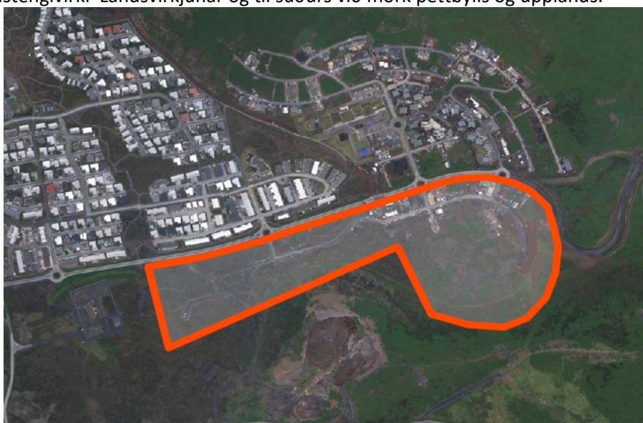
Loftmynd sem sýnir afmörkun Hamraneshverfis M3

Hamranesið M13 afmarkast af Ásvallabraut til norður og austurs til vesturs við rafmagnstengivirki Landsvirkjunar og til suðurs við mörk þéttbýlis og upplands.